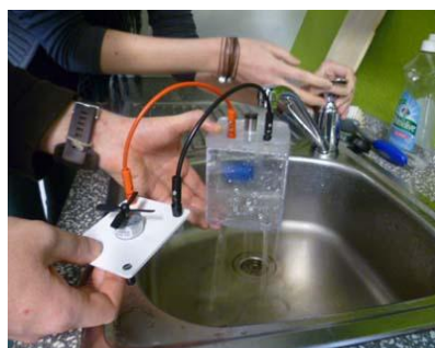
Bilder aus den Fachseminaren EE 2012